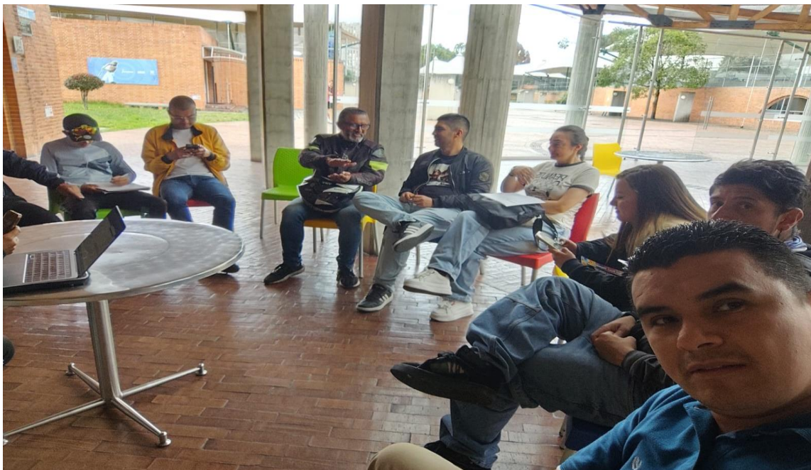
Reunion operativa Zona 6 junio 19 de 2026.