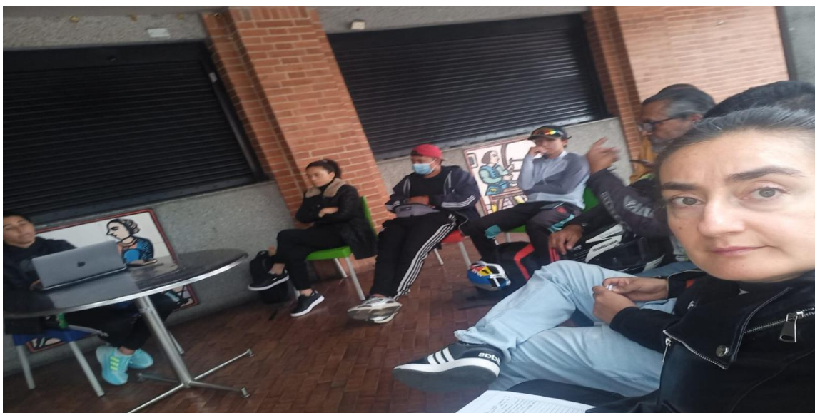
Reunion operativa Zona 6 junio 19 de 2026.